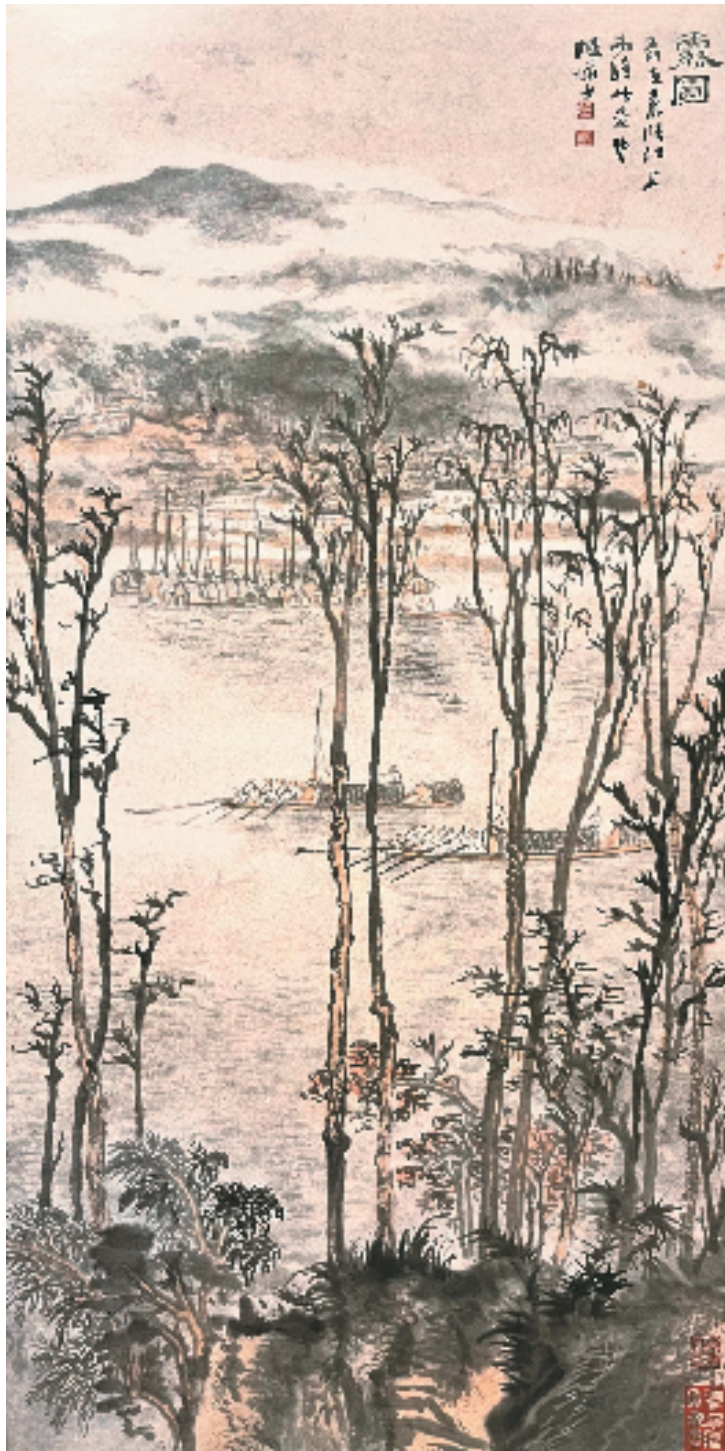
陆俨少 雾图 68x34cm 1975年