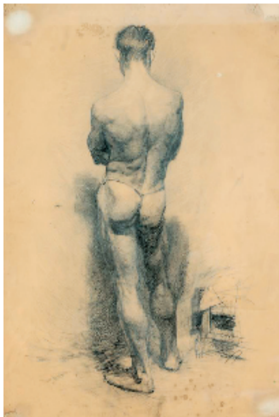
全山石 男人体 1957年

素描与格物精神——广州美术学院绘画专业素描教学20年。该专题以若干教学改革实践和个案，呈现广州美术学院在改革开放初期至新世纪之初绘画专业基础素