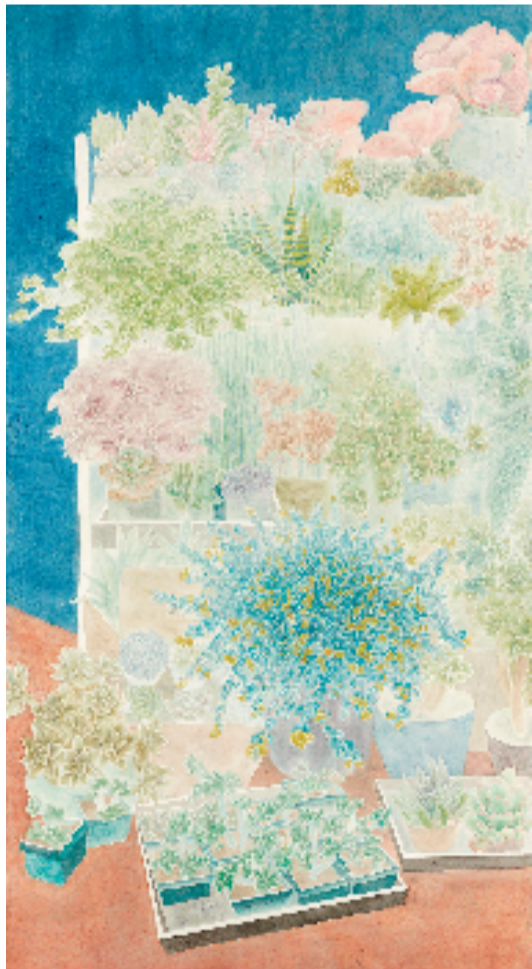
钱芬(衢州高级中学教师) 许你四季如春 中国画