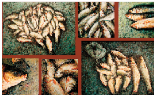
袁良波(衢州高级中学教师) 鱼 油画