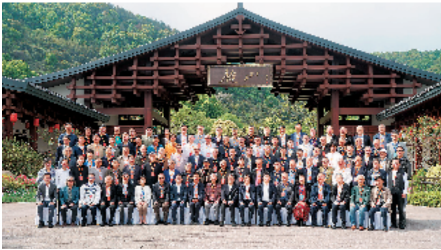
西泠印社春季雅集合影

本报讯 记者 施涵予 江南四月，春和景明。4月19日至21日，百余位西泠印社社员、诗书画印同道从天南海北奔赴杭州，参加一年一度的西泠印社春季雅集活动。 今年，是西泠印社首任社长吴昌硕先生诞辰180周年。此次西泠印社甲辰春季雅集系列活动特安排在吴昌硕长眠之地——临平超山举行，祭拜印学先贤，举行雅集笔会，进行学术交流，一起仰先贤、求友声、探春光，重温跨越千年的传统文人雅集氛围。 西泠印社与临平超山有着深厚的渊源。吴昌硕一生爱梅，以梅为知己，晚年常在超山赏梅作赋，留下了珍贵的书画篆刻作品，还和友人在中国五大名梅之一的宋梅旁筹建了宋梅亭，在庭边亲手栽种蜡梅一株。 雅集笔会是每年春季雅集的保留项目。本次笔会，百余位社员与嘉宾现场泼墨挥毫，各显身手。创作的数百件作品全部捐献给临平区超山风景名胜區管理委员会收藏。