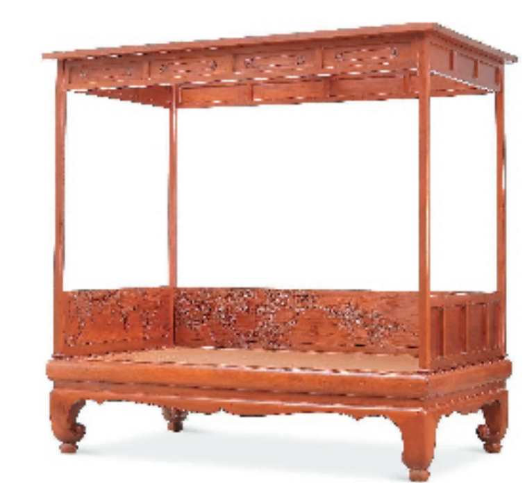
明万历 黄花梨刻诗文苍松葡萄图四柱架子床 中贸圣佳2019秋季拍卖会 成交价:人民币 50,025,000