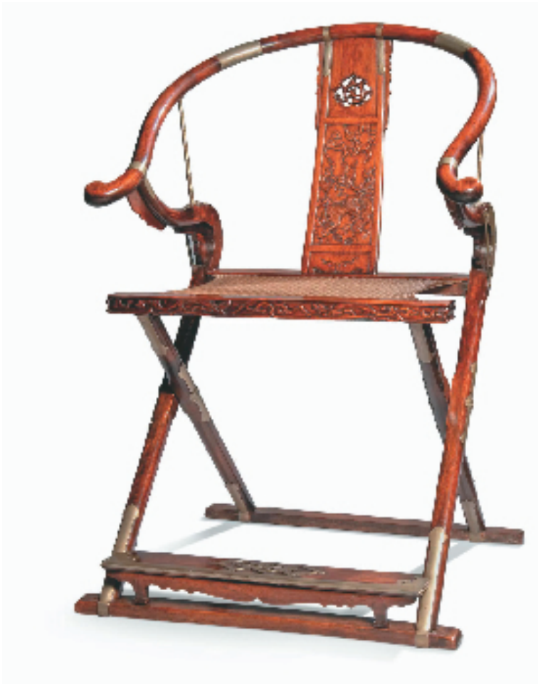
明末清初 黄花梨麒麟纹圈背交椅 佳士得香港2021年春季拍卖会 成交价:港元 65,975,000