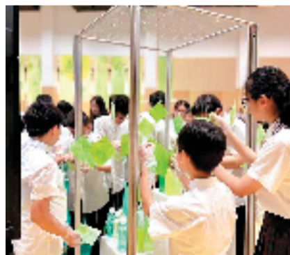
单元课程展示现场

浙江省山区海岛26县市区美育行动成果展示环节,来自全省不同县市的校长和教师代表们分享了他们在美育教学实践中的经验与心得,探讨了如何利用好当地文化资源,并将美育融入日常教学,让学生在美的熏陶中健康成长。