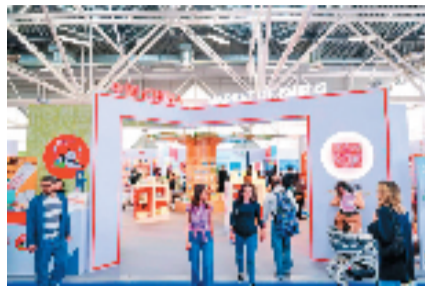
第61届博洛尼亚国际儿童书展中国展区

中国图书展区精选2500多种童书参展,重点展览展示《习近平讲故事(少年版)》《少年中国说:我读〈习近平谈治国理政〉》等,集中展示《中华先锋人物故事汇》《中华优秀传统文化少儿绘本大系》等精品丛书套书,以及《三体漫画》《青铜葵花》等原创精品儿童文学图书、绘本和科普读物,以书为媒讲述弘扬真善美的中国故事,增进各国读者特别是青少年对当代中国的了解,构建人类命运共同体的“童”心圆。