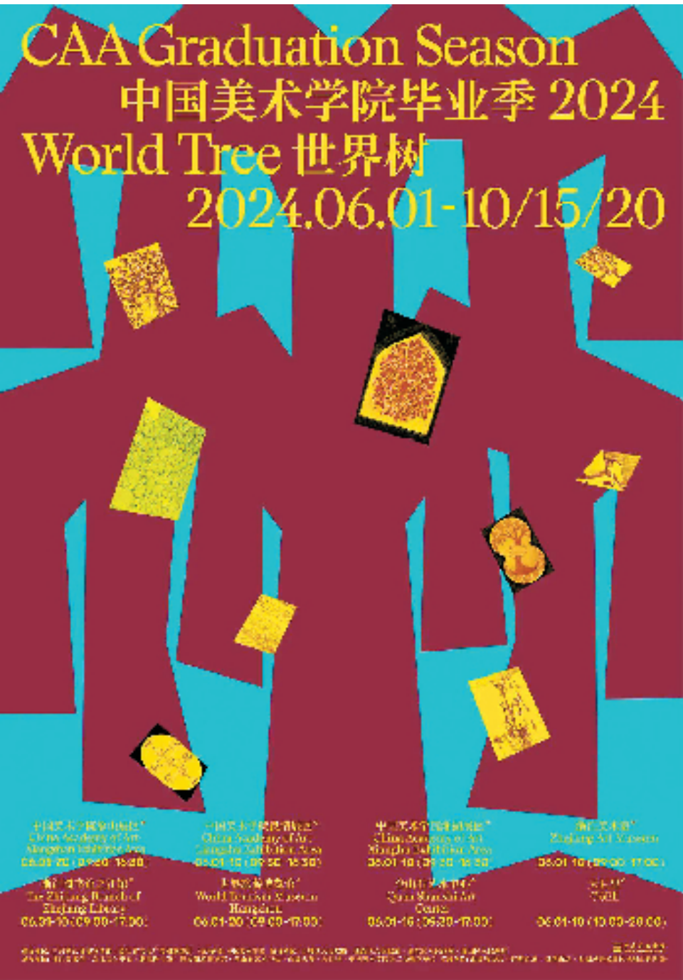
“世界树·2024中国美术学院毕业季”海报