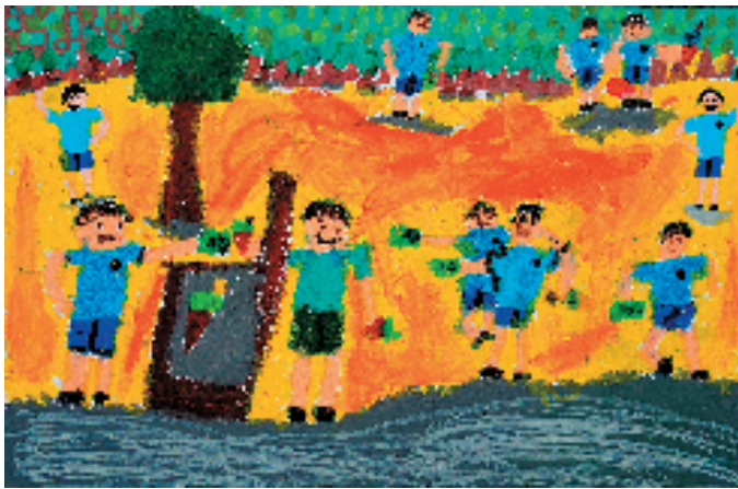
▲计疆铭(浙江省平湖市广陈中心小学(前港校区))我们爱劳动 指导老师:邱萍 作品描绘了孩子参加劳动的场景,小作者用简单的线条勾勒出人物轮廓,并通过涂色来表现衣服的颜色。他们还巧妙地运用了对比色来突出重点部分,如蓝色衬衫与橙色背景形成鲜明对比,使人物和场景更加生动有趣。