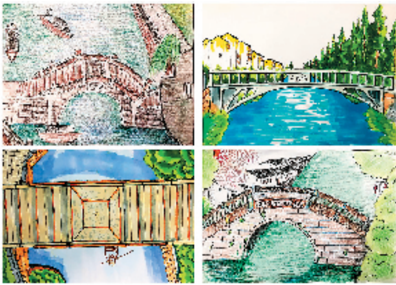
▲张琳、左少羽(浙江省海宁市许村镇中心小学)上塘水梁 指导老师:徐洁 作品围绕“上塘水梁”这一主题展开,从不同角度切入。比如,有的聚焦于桥梁的结构美,有的则侧重于水乡生活的生动场景。这种在统一主题下的多样性探索,各自独立而又相互呼应,共同构建出一幅丰富多彩的江南水乡画卷。