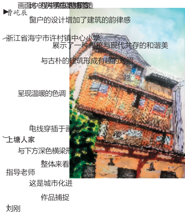
画面中的房屋结构独特,窗户的设计增加了建筑的韵律感 浙江省海宁市许村镇中心小学展示了一种传统与现代共存的和谐美 与古朴的建筑形成有趣的对照 呈现温暖的色调 电线穿插于画面 上塘人家 与下方深色横梁形成对比 整体来看 指导老师这是城市化进程中作品捕捉刘刚