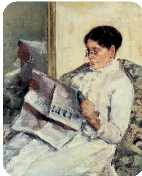
玛丽·卡萨特 阅读费加罗报 布面油画 1878年

卡萨特说:“画家有两条路可走:一条是易行的亨通大道,另一条是坎坷的羊肠小路。”她自称走的是后面一条路。由于其早年画作反复被沙龙和展览拒绝,因此卡萨特的一生都崇尚艺术的自由和平等,就像她画面中描绘的女性,不再是被凝视的客观对象,而是一批正在读书、看报、观剧、思考的富有力量的独立主体。