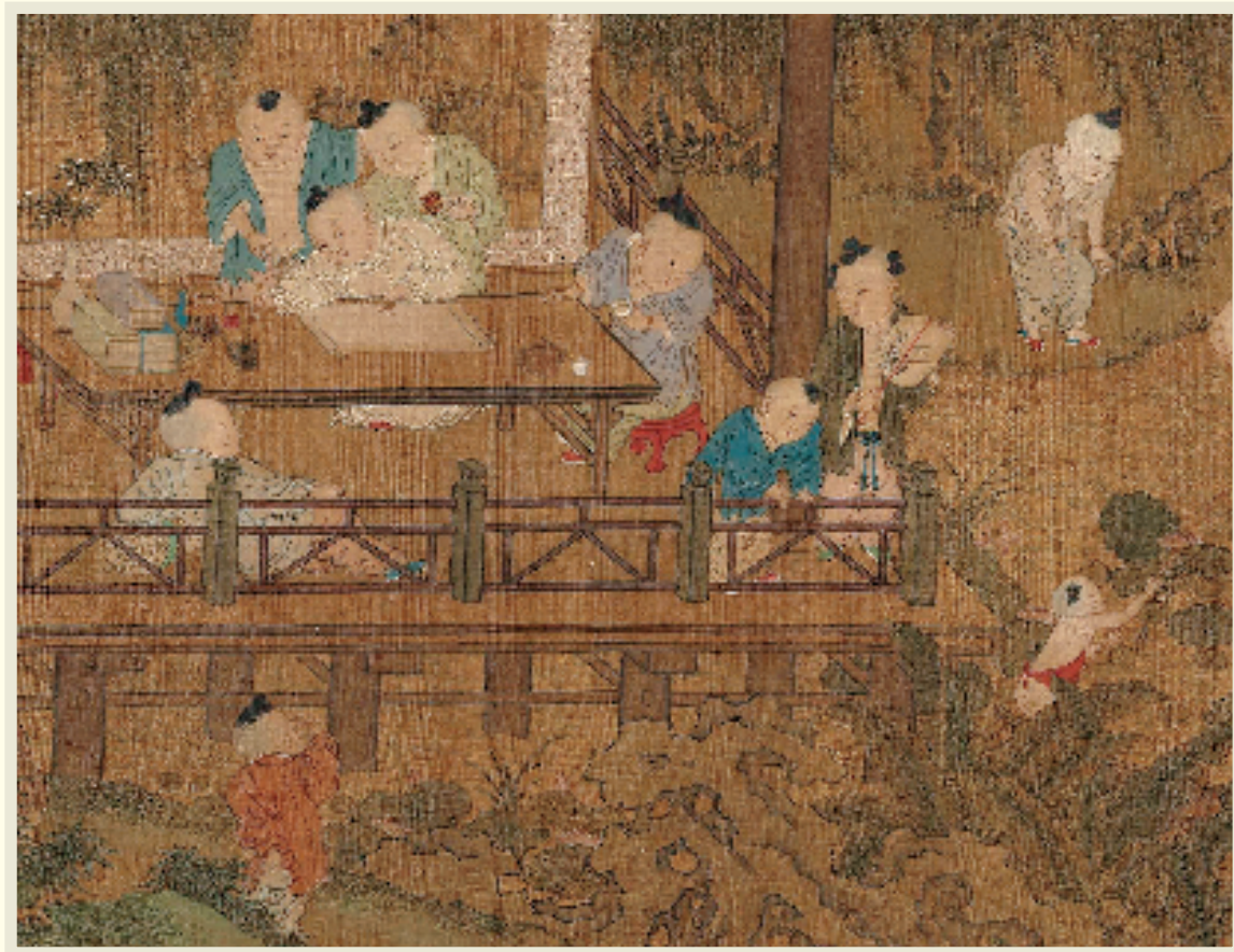
苏汉臣 长春百子图（夏景部分亭台局部）