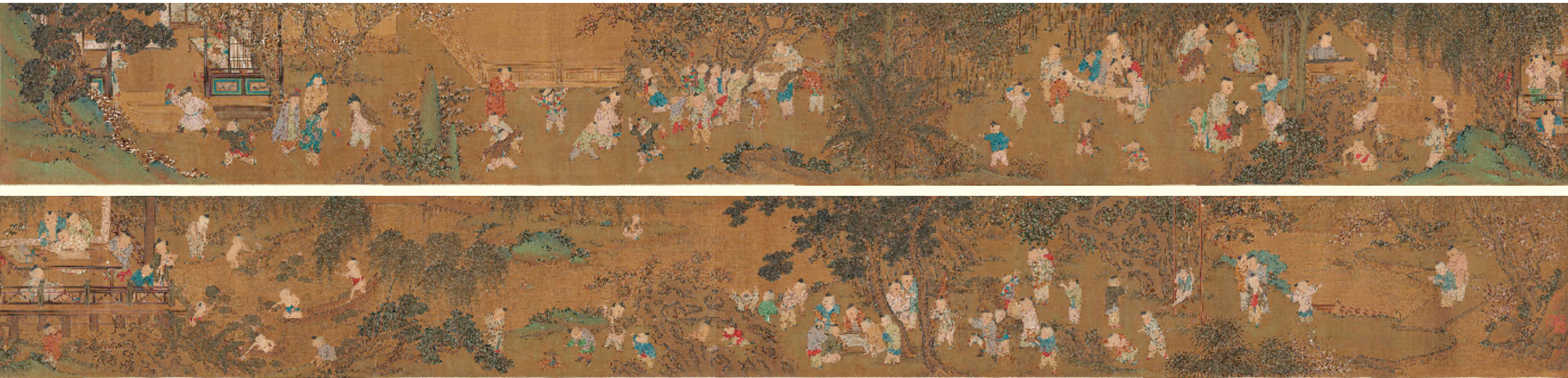
宋 苏汉臣 长春百子图 30.6x521.9cm 台北故宫博物院藏