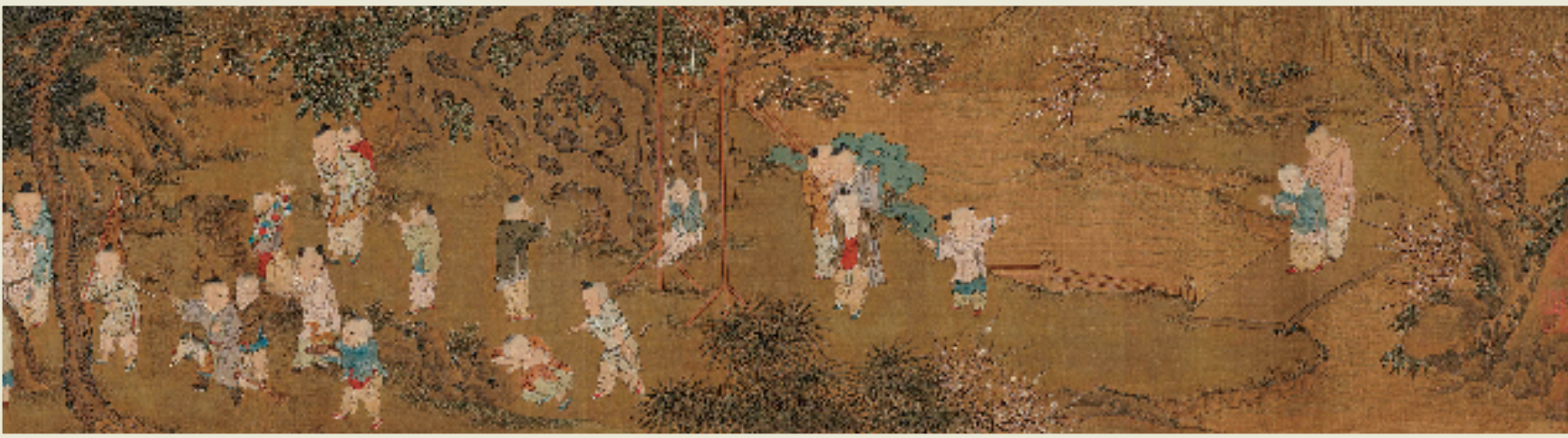
苏汉臣 长春百子图（春景部分截取）