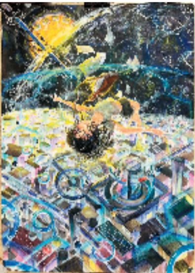
孙文茜(15岁) 浙江省台州市 台州市椒江学成艺术(特等奖)