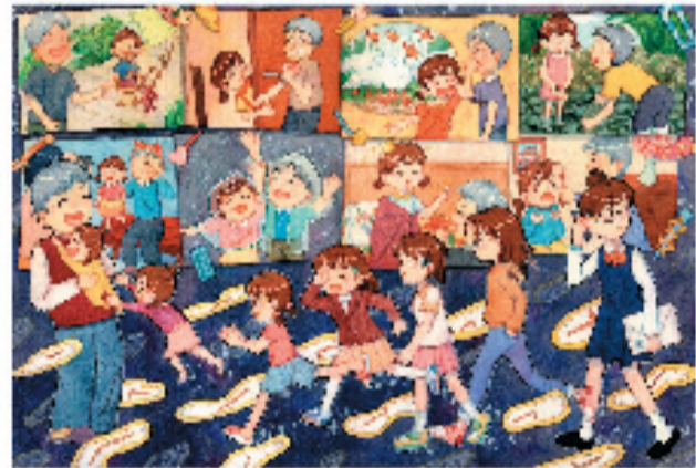
黎芳伶(15岁) 广西壮族自治区桂林市 童想国艺术创作馆(特等奖)