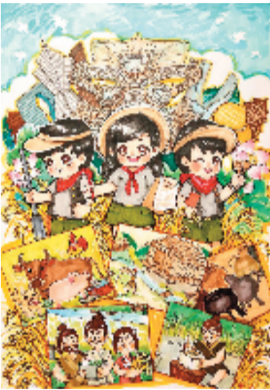
郑若惜(13岁) 浙江省杭州市 杭州少年书画院动漫社(金奖)