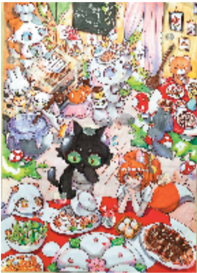
黄晏然(12岁) 广西壮族自治区南宁市 青少年活动中心(特等奖)