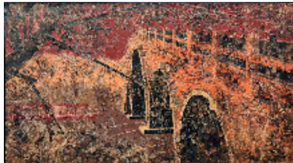
江林 词到静时落江南之三 110x200cm 油画