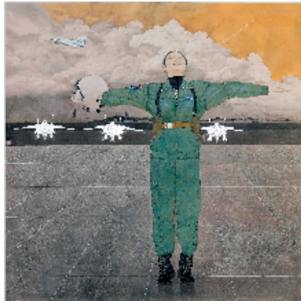
曹晶 当代巾帼 200x200cm 中国画

日前,“第十四届全国美术作品展览”中国画、油画安徽选送作品复评工作会在合肥举行,按中国美协分配给安徽的名额,共评选出中国画作品28件、油画作品25件。展品公开展示后,按要求送至相关展区参加终评。(报艺)