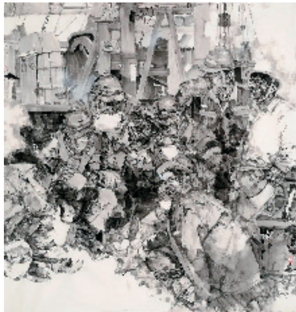
华杰 家乡传来喜讯 210x190cm 中国画

6月1日,第十四届全国美展山东作品展(中国画、油画)在山东美术馆开展。展览为全国美展选拔选送优秀作品,同时全面检阅和展示山东省五年来中国画、油画创作成果,为展示山东美术家创作实力搭建了重要平台。本次展览共有2500余件作品参加评选,最终遴选出入展作品397件,其中91件优秀奖作品将推送至全国美展中国画、油画展区,参加第十四届全国美展的最终角逐。展览将持续至7月14日,优秀奖作品展至6月5日。(报艺)