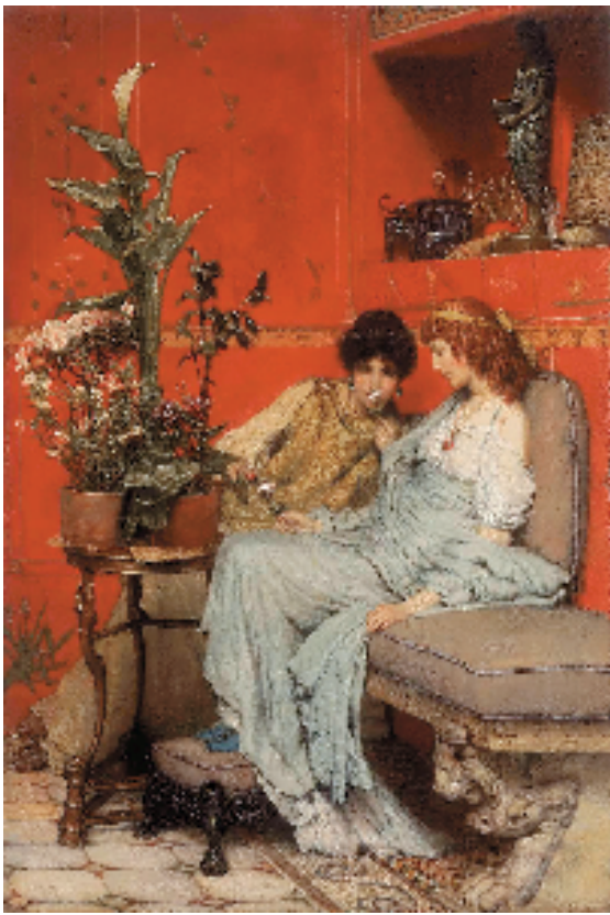
劳伦斯·阿尔玛-塔德玛 悄悄话 沃克美术馆 英国利物浦国家博物馆

“古风新尚与中国趣味”展现19世纪,越来越多的中产阶级希望通过服装、珠宝、配饰和家居用品来展示他们的品位、财富以及他们的生活态度和审美趣味。工业革命后,随着海上贸易的兴盛,更多样式的中国艺术品开始进入英国,包括单色陶瓷和景泰蓝。这场“中国风”对欧洲的社会生活带来了很大的影响,同时也成