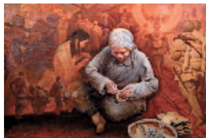
秦大虎 悠悠岁月 100x150cm 油画 1986年 烟台美术博物馆藏

本报讯 报艺 由中国美术学院、浙江省美术家协会主办的“气之沛然——秦大虎艺术文献展”于5月31日—6月30日在山东烟台美术博物馆(烟台画院)举办。 秦大虎1938年生于山东蓬莱,10岁参加部队文工团,开启军旅生活和艺术学习生涯。1956年考入中央美术学院华东分院(现中国美术学院)附中,1963年浙江美术学院(现中国美术学院)油画系本科毕业。1985年自济南军区转业至浙江美术学院,从事油画教学工作,直至退休,对中国美术学院新时期的油画教学产生重要的影响。 展览分为“戎马岁月”、“家国情怀”、“山河自在”、“艺苑传承”四个板块,共展出秦大虎先生的油画、素描、速写、创作小稿、文献、连环画等各类作品100余件(套),另辅以多层次的文献、实物等资料,从军旅、乡土、写生、教学各个角度全面展现秦大虎作为艺术工作者、军人、教师等