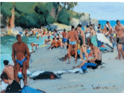
陆琦 意大利南部陶尔米纳贝拉岛游泳的人群 19.5x27cm 水彩 2023年

唐代经学大师孔颖达在其著述《周易正义》中有:“旅者,客寄之名,羁旅之称,失其本居而寄地方,谓之旅。”近年,常有一段“失本居而寄地方”的出旅。虽非长期居留他乡,但也有月余的心灵“漂泊”。出国旅行多了,虽行迹匆匆,也常常备些纸笔,在晨间或黄昏将异域的风情记录。展出的这些作品是四位画家一些油性或水性材料的小幅写生,记录了他们这几年身旅更是心旅在东京、京都、箱根、悉尼、墨尔本、塔