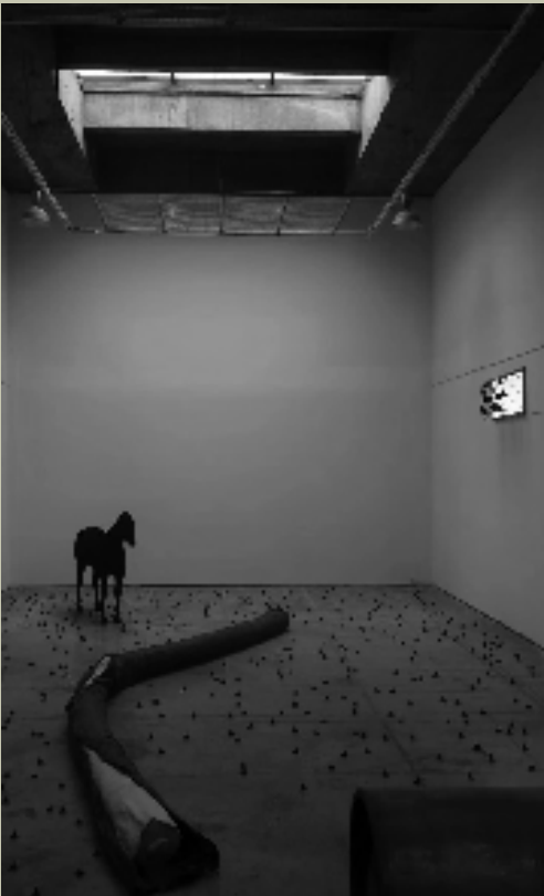
刘易 沉梦 综合材料 2023年