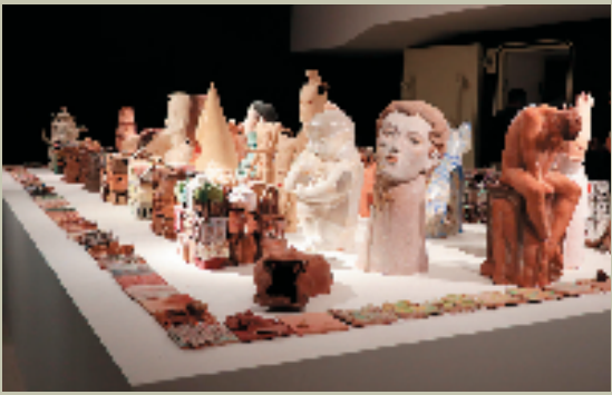
“淬炼”板块展览现场