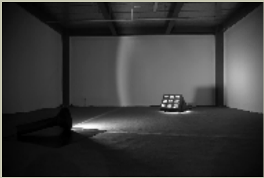
章献 危险的事物固然美丽 装置 2019年