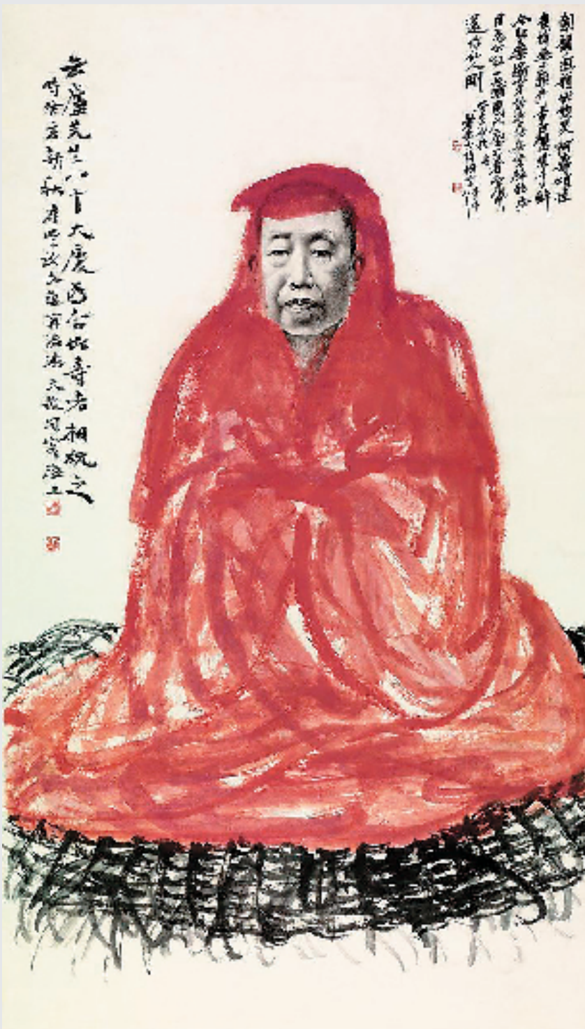
诸闻韵 潘天寿 吴昌硕八十寿像 140.5x79.8cm 1923年 浙江省博物馆藏

上海吴昌硕纪念馆推出“艺术璧采·光耀海上：纪念吴昌硕诞辰180周年文献展”，展出书信、诗稿、账本等百件文献类真迹，还有吴昌硕实际使用过的笔砚文房等用具，以及重要时期的书画代表作品，真实呈现吴昌硕当时的生活环境、交游状