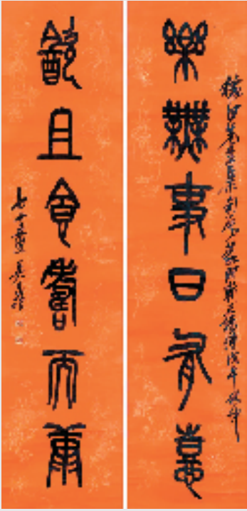
吴昌硕 篆书乐无饮且六言联 200x46cmx2 1918年 安吉吴昌硕纪念馆藏