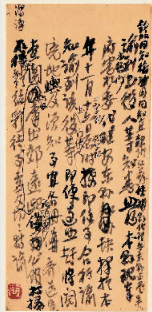
吴昌硕自留翰墨册“手书谕令”

上海吴昌硕纪念馆本次推出的“艺术璧采，光耀海上——纪念吴昌硕诞辰180周年特展（文献展）”，是继《线条之美——吴昌硕书法精品展》之后的又一个专题纪念展。 “文献”是我们真正了解艺术家的最佳窗口。通过传至今日的这些信札、诗稿、账本、以及他实际使用过的笔砚文房等用具，让我们能够真实感受到吴昌硕当时的生活环境，交游状况，笔墨生涯，从政经历，以及时势变迁，乃至吴昌硕彼时“天时”、“地利”、“人和”种种因素，由此可以看到真实而立体的吴昌硕。 本次展览展出了一批吴昌硕中年时期担任一个月安东县令（今江苏省涟水县）前后的书信、手谕、诗稿等等，其中有诗云：“旧黄河势抱安东，古木寒潭万影空。卧榻冷悬高士雪，卷茅狂听大王风。诗来淮上秋山里，人在天涯水气中。眼底石头真可拜，倘容袍笏借南宫。米元章曾为涟水军。”此诗刻入其篆刻《一月安东令》边款。信札还有描述安东民风、民俗、环境，使我们得以与其他文献相照应，解读其为官一月的真实缘由。在封建“学而优则仕”的年代，多少知识分子的人生目标是考取功名为官。吴昌硕放弃科考，却和另一位文人艺术巨匠赵之谦一样，当上了“七品”县令。不同的是，赵之谦为官后放弃了篆刻，减少了书画创作，留下了历史性的遗憾；吴昌硕觉悟得快，《弃官先彭泽令五十日》（吴昌硕篆刻），仅仅一个月，便辞官回归艺术。那之后，移居上海，从此吴昌硕的艺术人生真正生发出了“光耀”，成就了艺术家，更照耀了海上艺术，影响海内外。 百十页信札以及极难得一见的书画账本，配以相关的书画扇面手卷等等，信息量巨大，广大观众在欣赏吴昌硕作品的同时可以细细品读，或于学习、研究当有裨益，则本次展览就有了意义。