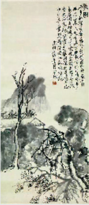
吴昌硕 芜园图轴 1893年 浙江省博物馆藏