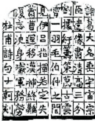
张士轲 篆刻 释文:万古云霄一羽毛