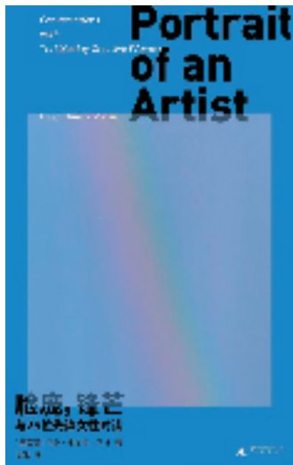
《脸庞，锋芒： 与25位先锋女性对话》 [墨]乌戈·韦尔塔·马林/著 于是/译 广西师范大学出版社/出版