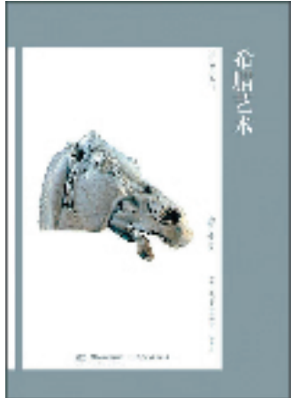
《希腊艺术——艺术与观念》 [英]奈杰尔·斯皮维/著 陈雷/译 湖南美术出版社/出版