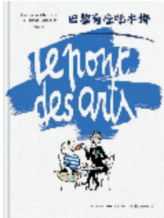
《巴黎有座艺术桥》 [法]卡特琳·莫里斯/著 李珈仪/译 生活书店出版有限公司/出版

我的这些文字，“思无邪，知述圣；行毋我，事随人”，当然不能成为推动个人和社会发展的动力，但应该有益于个人和社会和谐的稳定。