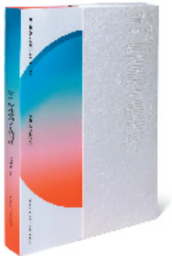
《东方色彩与生活方式》 成朝晖/著 中国美术学院出版社/出版

在这个全球化迅速发展的时代，保留并发展东方独特色彩在现代设计中的应用，已成为设计界一个重要议题。