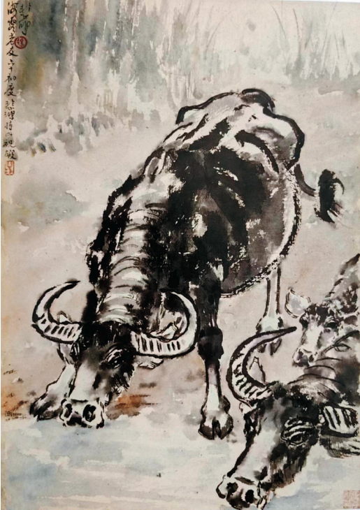
徐悲鸿 牛饮图 38×54cm 1953年