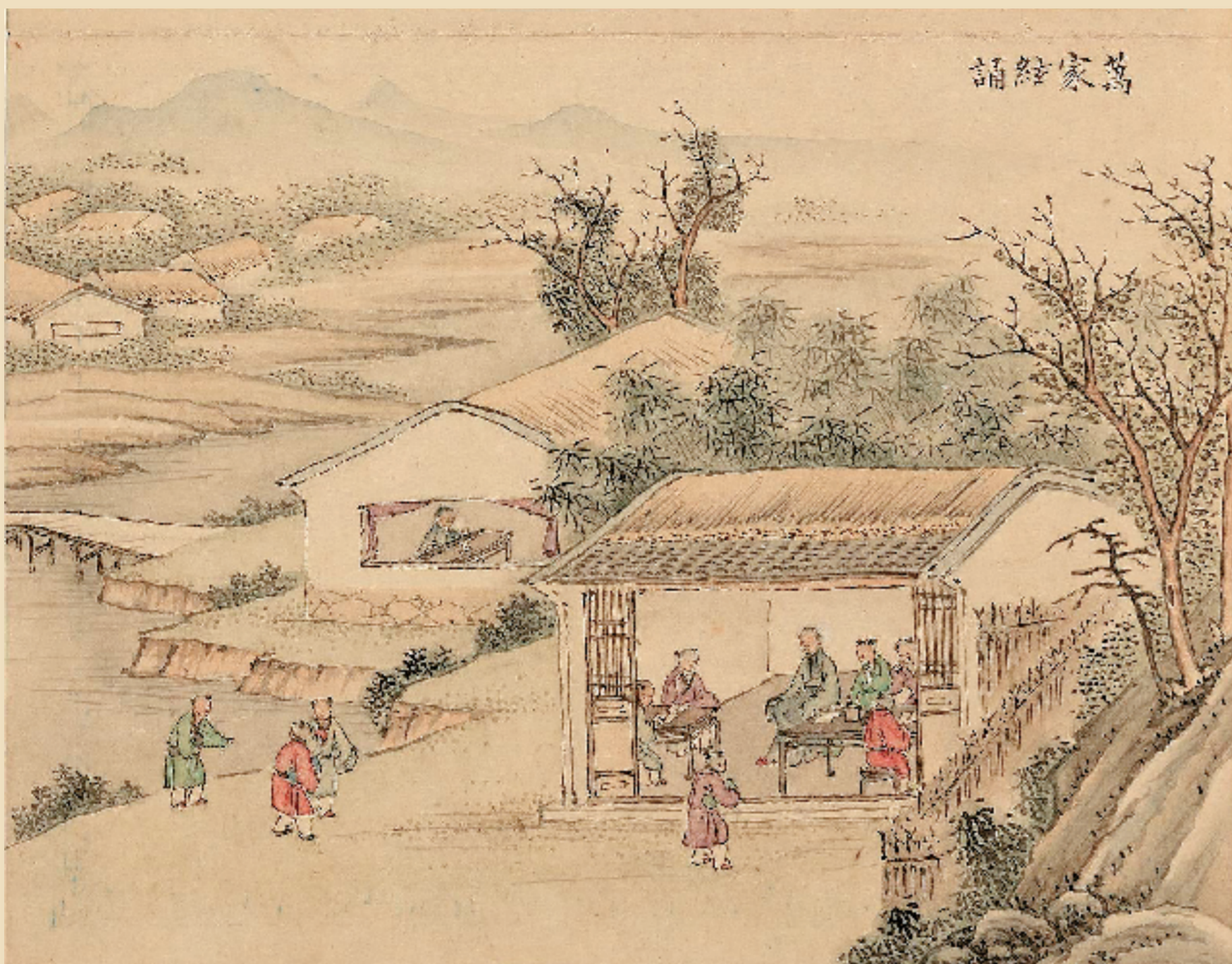
清 刘权之 忆春书瑞册图(家弦卷) 纸本册(推蓬装) 台北故宫博物院藏