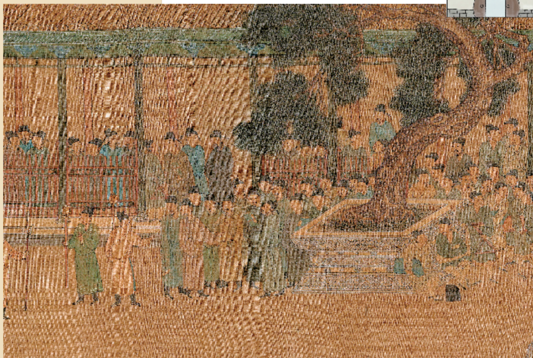
明 仇英 观榜图(局部) 台北故宫博物院藏