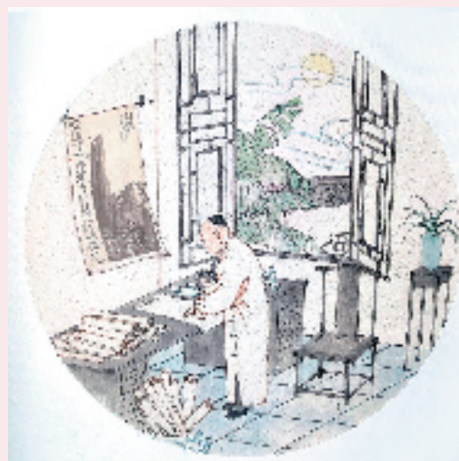
洪万里 空谷幽兰图