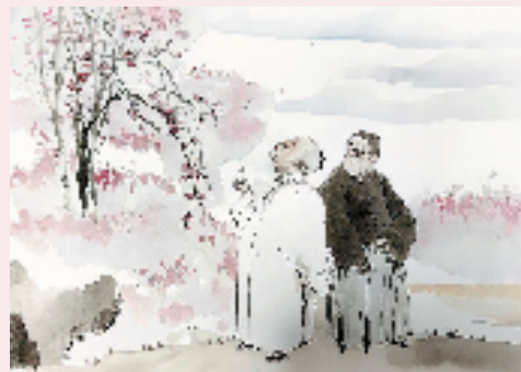
宓风光 梅花忆我我忆梅