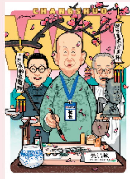
尚亚伟 吴昌硕各种“梗”