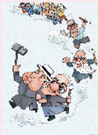
陈长兴 吴昌硕的朋友圈