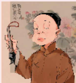
方泽芳 吴昌硕漫画头像