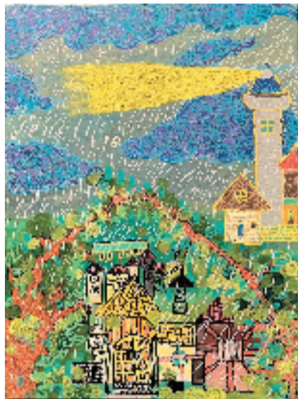
王延卿 暴风雨中的灯塔 布面综合材料

近日，春城盛夏，阳光灼热，白云耀眼，由云南省昆明市文化艺术教育协会主办的“相看·相遇”艺术作品展在昆明市博物馆正式拉开帷幕。1600多人参加开幕式。展览汇聚了500余名大小艺术家的心血之作，以一场跨越年龄与界限的艺术对话，为春城带来了前所未有的文化冲击与视觉享受。