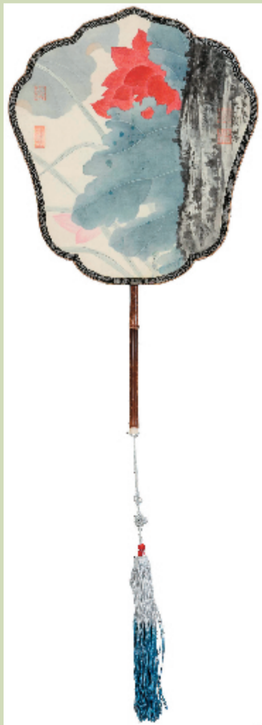
陶莲霞 翠盖红蕖 28x30cm 2024年