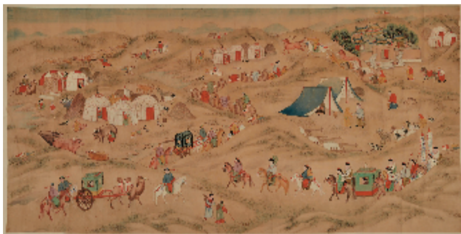
清 佚名 行乐图 纸本设色 中央美术学院美术馆藏