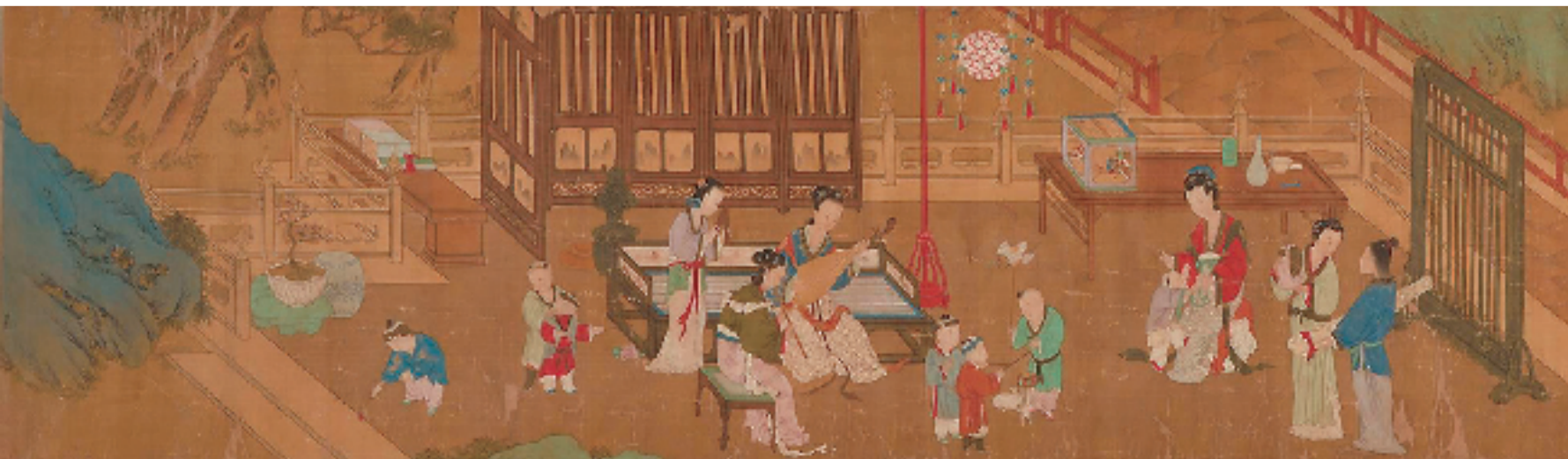
周文矩(款) 观灯图(局部) 绢本设色 中央美术学院美术馆藏