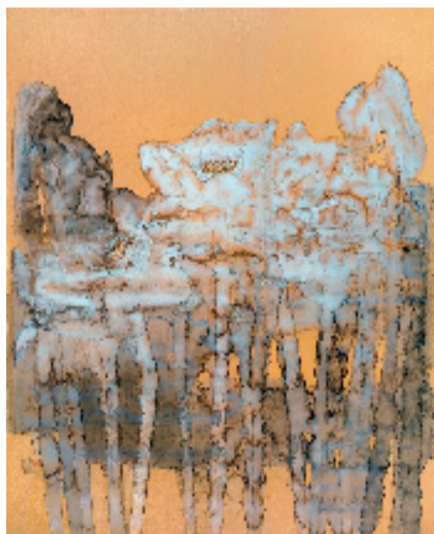
林蓝 梦澳门 1999 211x171cm 国画