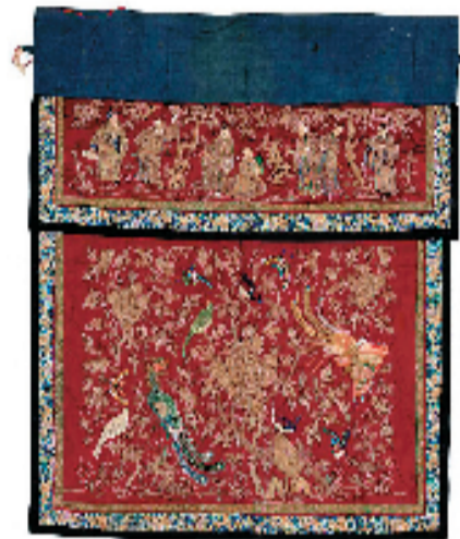
民国 红缎潮绣甘罗十二为丞相桌围 112x95cm 布面 广州美术学院美术馆藏