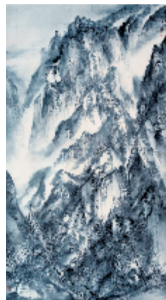
石纲 雨翠岩图 183x99cm 国画

本报讯 通讯员 阮超怡 9月8日,由湖南省文化和旅游厅主办,湖南省艺术研究院、广州艺术博物院(广州美术馆)、湖南省书法院承办的“同频共振——湘粤书画交流展”在广州艺术博物院(广州美术馆)开幕。开幕式由湖南省文化和旅游厅党组成员、副厅长周志勇主持。