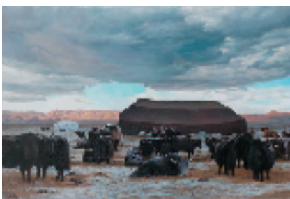
王冀中 美丽家园 80x120cm 布面油画 2017年

值得一提的是,油画作品《奋斗号》成功入选国家艺术基金2022年度美术创作资助项目。在此作品中,画家巧妙地将火车头这一工业时代的标志性元素作为画面核心,通过描绘火车头喷出的磅礴蒸汽,深刻体现了国人的奋斗精神。此外,还特别展示了他中在动画领域的部分重要作品。他注重将传