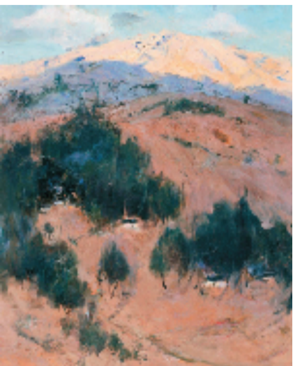
林岗 日落时分 45x35cm 木板油彩 1963年 艺术家自藏

本报讯 通讯员 徐新立 9月11日-10月13日,由中央美术学院主办,中央美术学院党委宣传部、中央美术学院美术馆、中央美术学院油画系承办,中国国家博物馆、北京美术家协会支持的“大艺不言——林岗先生百岁艺术展”在中央美术学院美术馆举办。