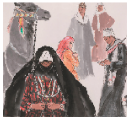
张迪平 埃及印象系列1 52x57cm 中国画 2013年

张迪平,1965年进入上海中国画院工作,见证了上海中国画院的发展。她早年专事人物画,画风朴实,深入生活,致力于捕捉生动的形象,创造了时代性、思想性与艺术性兼具的经典之作。1980年代起,逐步开启对“内在语言”表达的探寻,并在转向花鸟和山水创作实践的过程中得到对绘画与生命