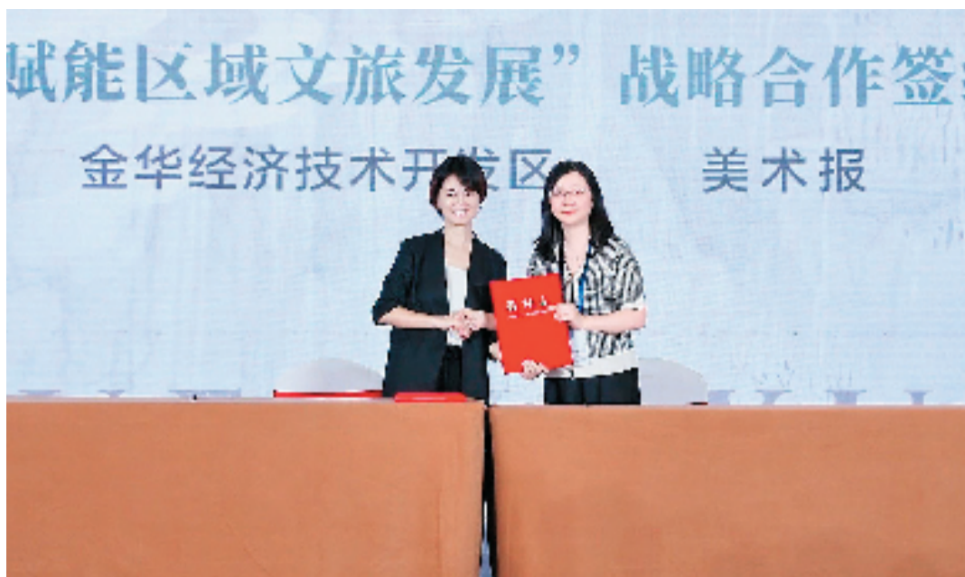
金华经济技术开发区与美术报签订“文化赋能区域文旅发展”战略合作协议

自然景观作为当代社会的重要资源,其现实价值通过艺术家的创造性转化得以彰显,提升至精神层面的高度,使得自然的表与开发过程富含更深层的文化意义与精神追求。这正是本次活动的核心价值所在。因此,此次活动是为了一项具有前瞻性的尝试,预示着未来可能将此类艺术探索与实践推广至更广阔的领域,以期在更广泛的社会与文化背景下,挖掘并展现其独特的当代意义与价值。