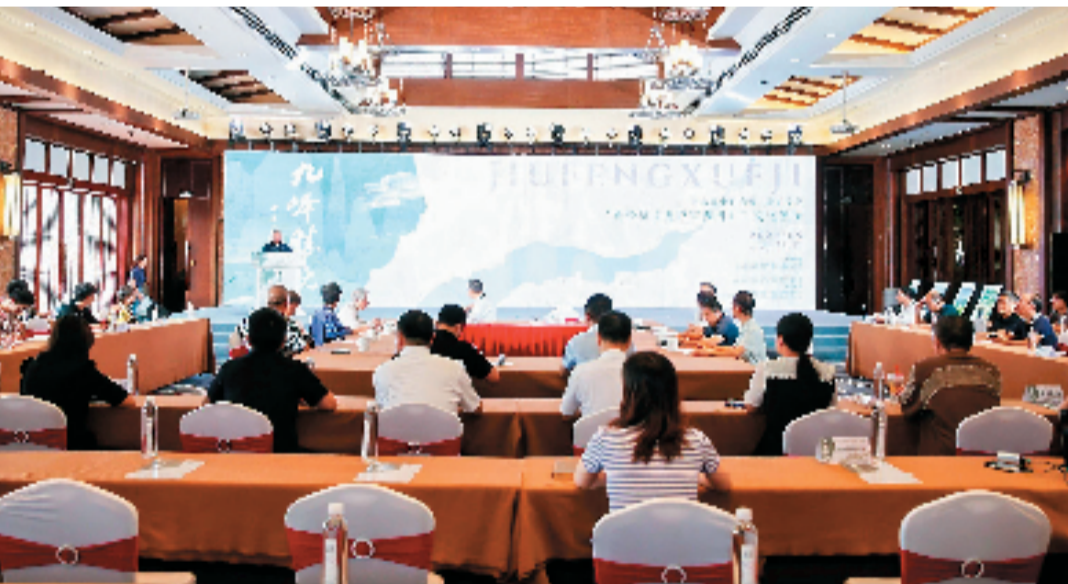
黄公望《九峰雪霁图》文化溯源会现场