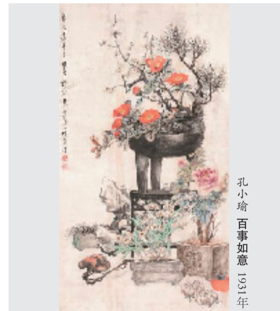
孔小瑜 万事如意 1931年

孔小瑜(1899—1984),出生于浙江慈溪,祖籍山东曲阜,上世纪五十年代起长期在安徽从事艺术创作与教学工作,一生勤于绘事,以身立教。以博古花卉饮誉艺坛,是安徽现代美术事业发展中具有重要影响的代表性艺术家之一。