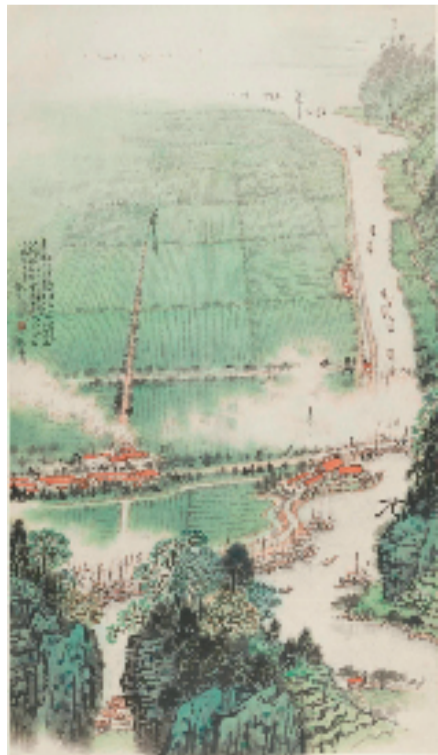
钱松喆 锦绣江南鱼米乡