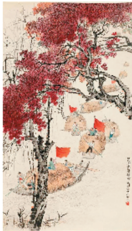
钱松喆 水上高歌丰收归

建筑沿着尚湖而建，在湖港上由多座拱桥连接着两岸，湖中帆船点点，湖泊河道两岸是平整的良田，河道蜿蜒曲折地延伸至远方。在设色上，以石绿色调为主，营造出生机盎然的景象。题识云：“解放以来，太湖渔民在党的领导下，重新安排河山，垦田建村，亦渔亦农，从此登陆定居，不再终年漂泊水上，年年欢庆渔米丰收，一片繁荣景象，此谨写其一角。”这幅作品表现出了江南鱼米之乡的秀丽景色，热情讴歌了新中国农业建设带来的巨大变化。