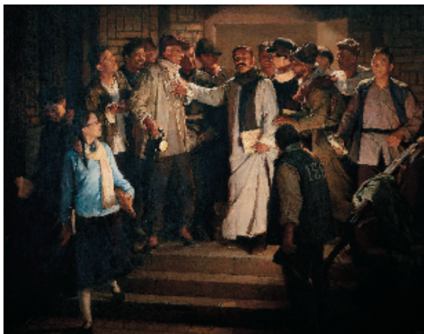
李前 工人是“天” 180×230cm 油画

在历史画创作中,这个故事发生在哪里?这些人在什么地方?对此要有非常严格的要求。我在这幅作品构思开始的时候,是想把情节安排在机修车间,有很多工人在围绕着李大钊听演讲,但后来放弃了。因为事件的发生是在劳动补习学校,那么就切入主题,画李大钊在劳动补习学校。这个场面,以前也曾有人画过,但往往把他画在教室里面。为此,我做了很多准备工作,形成了很多方案。由于我认为把主人公画在教室里上课这个情节有些常见,于是我就设想把他画在门口讲课,讲台就安排在门口,我们从门外面看进去,教室里肯定已经坐满