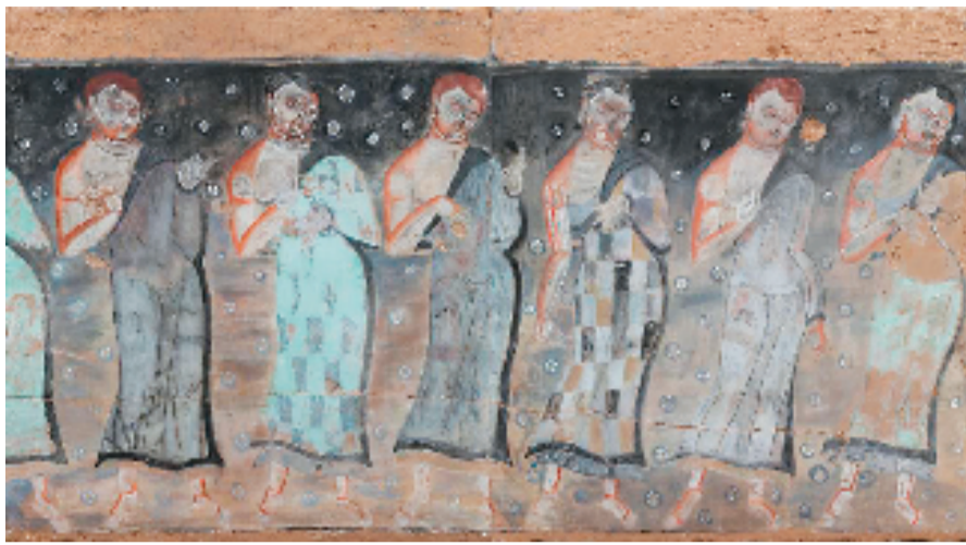
孙卉 克孜尔石窟175窟 供养人(临) 140x65cm 泥板、矿物色

本次展览汇聚了23件极具历史价值和艺术价值的石窟寺壁画临摹精品,是中国艺术研究院自2016年以来对中国新疆、甘肃等地区的石窟寺壁画临摹作品的一小部分,展现了古丝绸之路中西方艺术交流