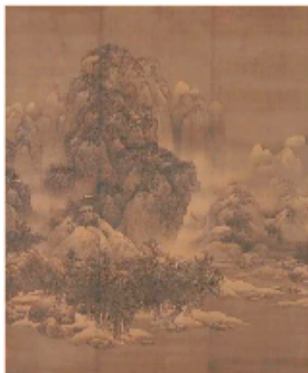
宋 范宽 雪景寒林图(展出为复制品)

继今年6月赴白俄罗斯进行首展后,本次“东方雅韵”中国文化艺术展赴西班牙展览成为该展海外巡展的第二站。值得一提的是,本次展览纳入文旅部“天涯共此时”全球联动框架内的展览项目,同时亦成为“遇见天津 感受中国”天津文旅品牌海外首次亮相的主推项目。展览充分利用天津博物馆丰富文物资源,借助高水平文化艺术品+多媒体互动+现场体验活动等多种表现方式,旨在向世界展现天津文博形象,