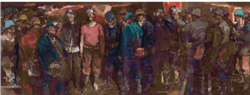
周刚 新来的矿工 150×420cm 水彩画 2018年

本报讯 记者 俞越 9月24日，“惟望远山——周刚作品展”在宁波美术馆开幕。本次展览由浙江省文化广电和旅游厅指导，中国美术学院、中国美术家协会艺术委员会主办，宁波美术馆承办。