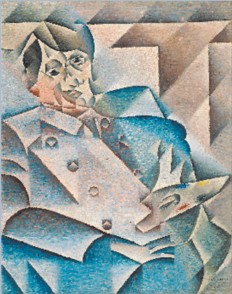
▲莫迪里阿尼 胡安·格里斯 54.9×38.1cm 布面油画 1915 年 美国大都会艺术博物馆藏

胡安·格里斯曾说,他试图重新定性,从普通的型号出发,制造出一些特殊的个体……塞尚把一个瓶子变成一个圆柱体,他则是把一个圆柱体变成一个瓶子,变成某个瓶子。从中,不难看出格里斯艺术上的野心与目标。