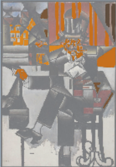
咖啡馆的秘密-黄色