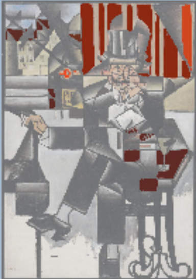
咖啡馆的秘密-红色