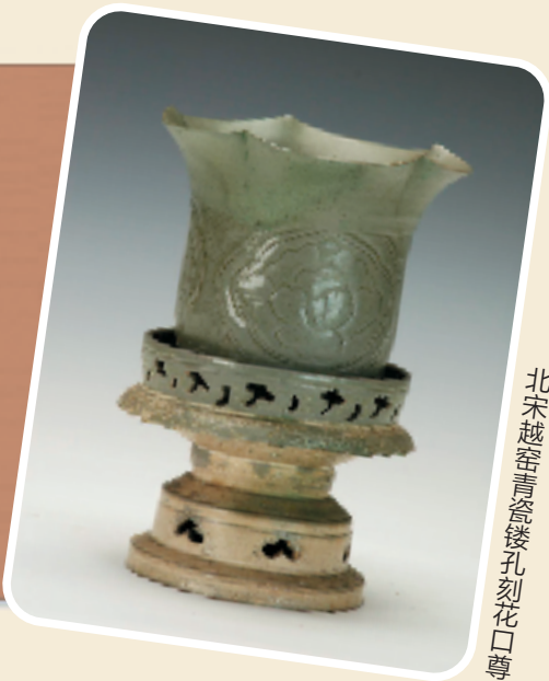
北宋越窑青瓷镂孔刻花口尊

文物名称：北宋越窑青瓷镂孔刻花口尊 文物级别：国家一级文物 具体年代：北宋(960~1127) 类别：陶瓷器 规格：通高 22 厘米，口径 13.3 厘米，底径 10.5 厘米