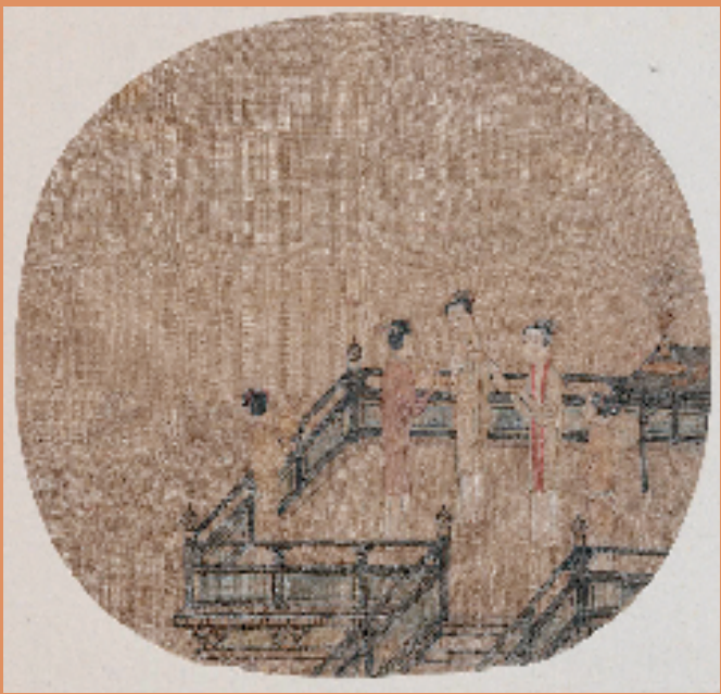
图3 南宋 陈清波 瑶台步月图(局部) 团扇 绢本 设色 25.6×26.7cm 故宫博物院藏