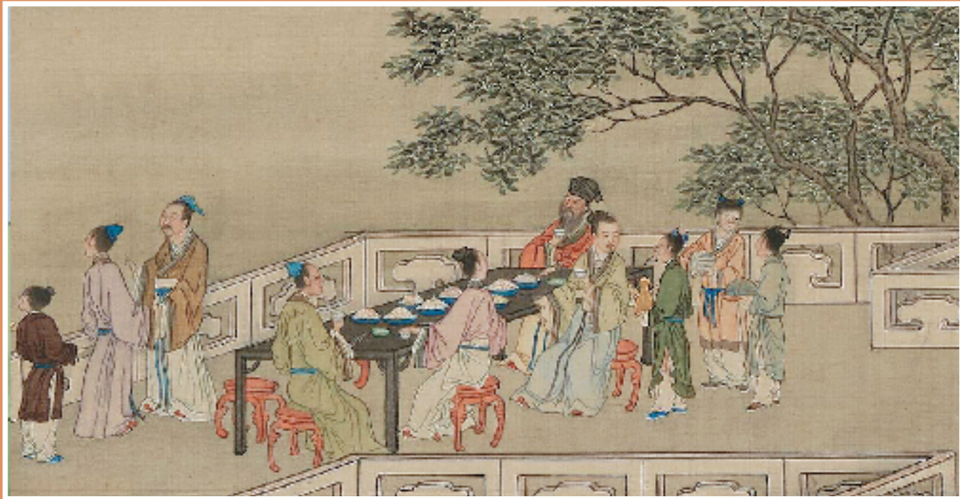
图2 清 佚名 十二月月令图八月(局部) 绢本 立轴 设色 175×97cm 台北故宫博物院藏

现如今,走月亮这个习俗虽然已经渐渐被大家淡忘,但幸有流传千古的诗词歌赋与绘画作品,依旧能激发人们无限的遐想与向往。更可喜的是,那轮明月依旧高悬夜空,晶莹剔透,充满灵性。此外,仍不乏有情怀之人,选择在中秋之夜,身披银辉,踏上寻觅之旅,穿梭于城市乡村之间——或许在某个不经意的瞬间,于街道驻足,你便能目睹那月光仿佛绽放成花,缓缓向你舞来,带来一份梦幻与浪漫。