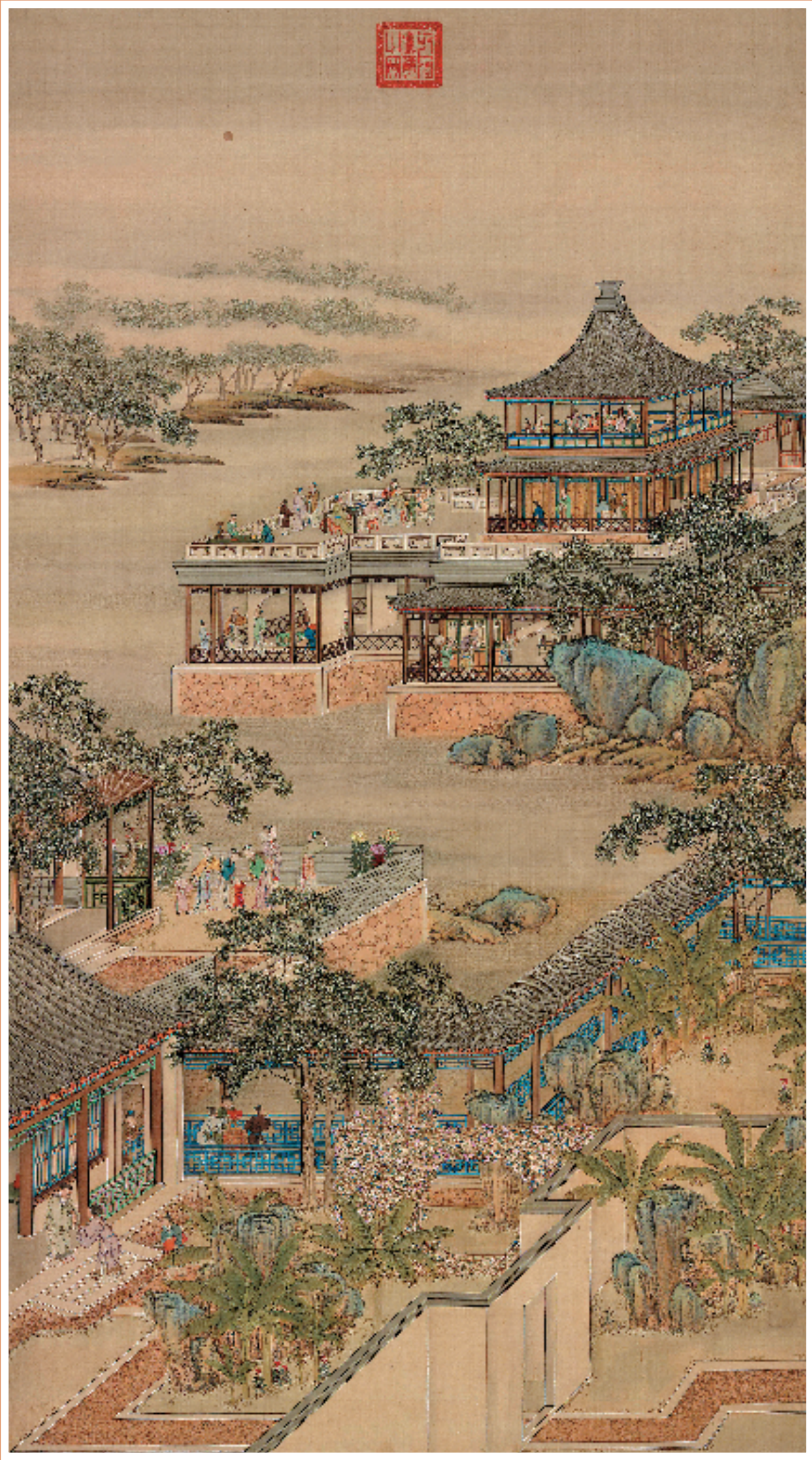
图1 清 佚名 十二月月令图八月 台北故宫博物院 绢本 立轴 设色 175×97cm

农历八月十五,是家人团聚、共享天伦之乐的中秋佳节,在我们中国人的心目中,它的重要性不亚于春节。这个节日源自于上古时期人们对于月亮的崇拜,在北宋正式被确立并盛行了起来,流传至今,成为了我们今日家喻户晓的节日。《东京梦华录》中记载了北宋都城汴京欢庆中秋的盛况:“中秋夜,贵家结饰台榭,民间争占酒楼玩月,丝簧鼎沸。近内庭居民,夜深遥闻笙竽之声,宛若云外。闾里儿童,连宵嬉戏,夜市骈阗,至于通晓。”在中秋月圆之夜,汴京这座古城焕发出不夜的光彩,成人们高举酒杯,沉醉于璀璨的星河之下,而孩子们则在欢声笑语中尽情嬉戏。夜市的喧嚣声中,人们的谈笑声与商贩的叫卖声相互交织,形成了一首生动的夜曲,直到东方露出了第一抹鱼肚白。你是否也被这种古代中秋的庆祝方式所吸引呢?那么现在,就让我们穿越时空,透过古画的笔触,去感受那份古老的节日气息,一同与古人启程“追月”之旅吧!