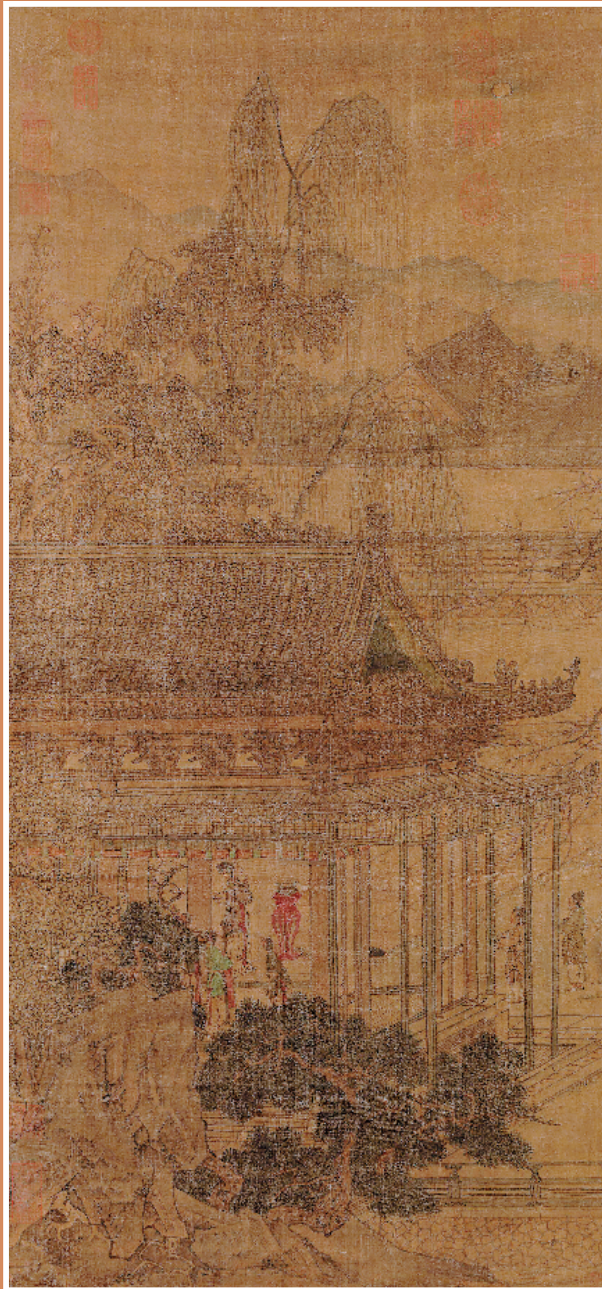
图4 宋 佚名 拜月图 立轴 绢本 设色 103.8x48cm 台北故宫博物院藏