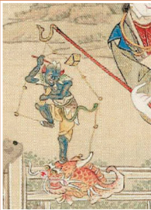
▲图6 清 佚名 升平乐事图册(局部)