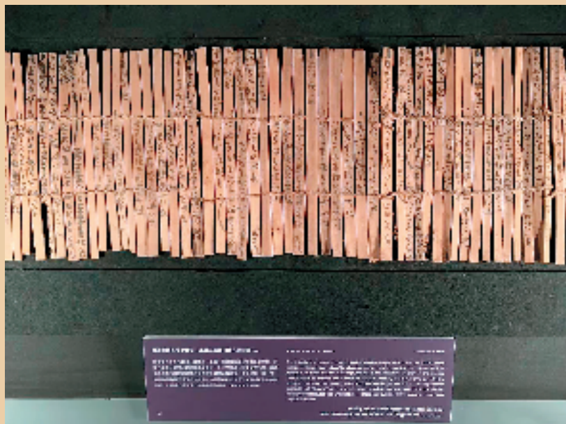
“中央研究院”汉简展品

2009年,350余枚汉简出土于浙江湖州的子城遗址,它们既是两汉时期乌程县署遗留的实物见证,更是浙江地区首次出土的汉代简牍。