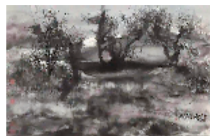
宋雨桂 槐露 60x93.5cm 1993年

宋雨桂(1939—2017),被誉为“当代中国山水画第一人”,独创北派山水画技法,擅长山水、花卉、书法,尤以山水著称于世。他的鸿幅巨制曾屡屡引发轰动和关注。2011年由他主笔的《新富春山居图》长卷轰动画坛,饶宗颐欣然写下:“逞一时之盛举,百代之瑰宝。陈佩秋从用墨、表现内容、创作技法等方面将新图与黄公望的《富春山居图》进行比较,认定:此卷不输于久画卷。同样,他最后留下的经典巨制《黄河