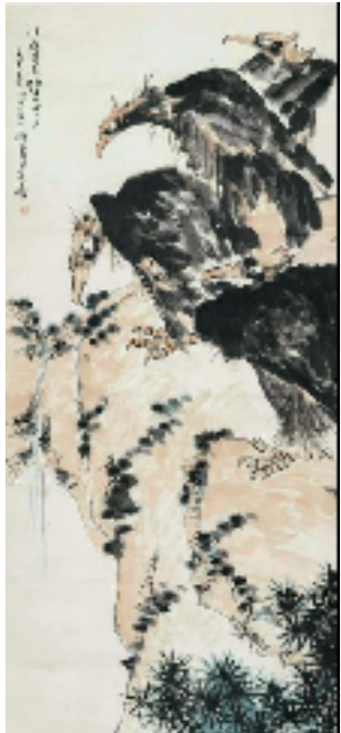
潘天寿《四鹰图》镜心 235×111cm 成交价2875万元 北京华辰 春季拍卖