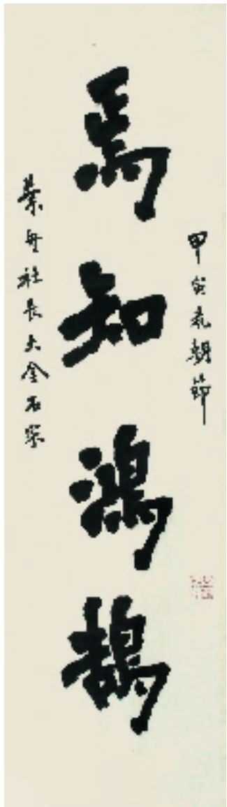
李叔同 楷书四言联