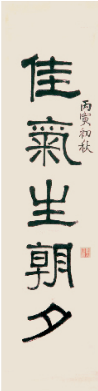
清 莫友芝 隶书五言联