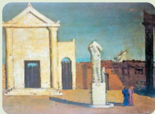
乔治·德·基里科 秋日午后之谜 1910年

基里科在画面中所搭建的那座看似无人存在的城市、空旷寂寥的广场、笔挺的建筑与强烈日照下的时空感,这样的组织,是现实与想象的结合,与基里科的成长经历有关,也与他的梦境有关。