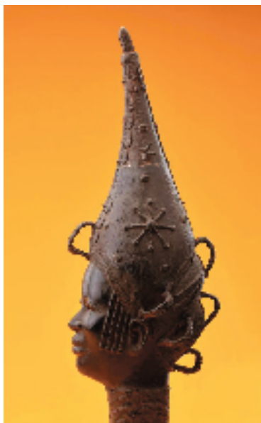
【尼日利亚】母后铜头像 27x34x100cm 黄铜 18世纪