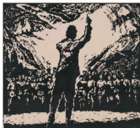
甘正伦 怒吼吧——黄河 56x62cm 版画 1982年