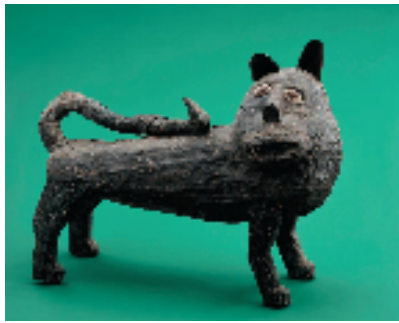
【贝宁·丰族】狮子像 82x28x68cm 金属 木头 18世纪