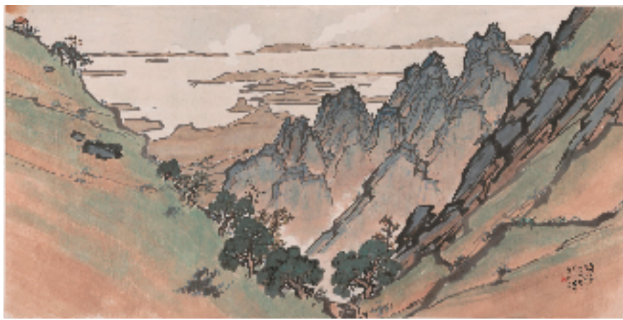
陈树人 鄱湖一览 80.5x161cm 纸本设色 1944年 广州艺术博物院藏

本报讯 通讯员 阮超怡 今年是陈树人诞辰一百四十周年，为纪念这位岭南画派创始人，探索其充满诗情画意的艺术人生，弘扬岭南画派艺术，加强对传统中国绘画艺术的保护和发展，广州艺术博物院(广州美术馆)“千里天然微笑处——纪念陈树人诞辰一百四十周年展”于10月25日在广州艺术博物院(广州美术馆)开幕。