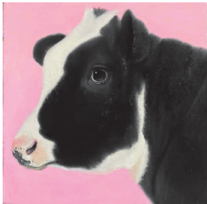
候琳琳 萌牛 20x20cm 布面油画 2021年