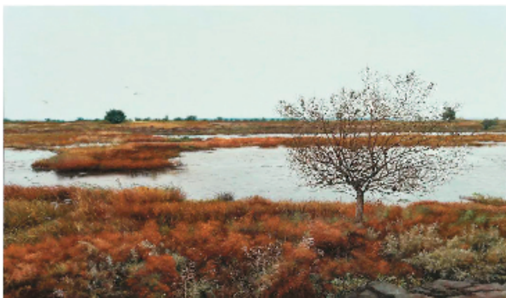
李大鹏 辽河之秋 120x70cm 布面油画 2022年