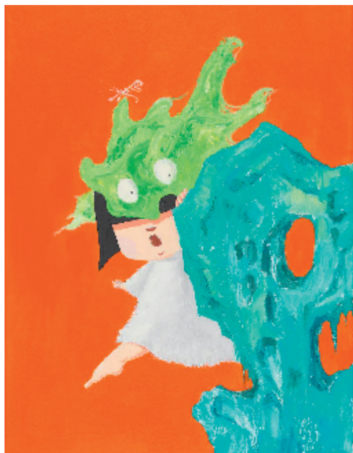
李睿 藏藏猫-地点1 30x20cm 布面油画 2024年