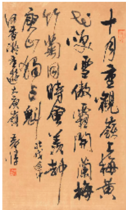
黄惇 行草书何香凝《重游大庾岭》诗

中国书法家协会主席孙晓云在特别录制的祝贺视频中表示，此次展览展出黄惇书法篆刻、理论研究等方面的100余件作品，时空跨越一个甲子，蔚为壮观。黄惇是改革开放后南京艺术学院招收的第一代书法研究生，也是当年书法专业的标志性人物，他的书法研究为当代的书法学科建设奠定了扎实的基础。他做了60多年的老师，研究了60多年的学问，桃李满天下，学术不离口，专业随身行，严肃、严格、严谨，刚直率真，毫不怠懈。刘恒在展览开幕式上作简短致词，他以孔子提出的古代君子“志于道，据于德，依于仁，游于艺”来概括评论深具传统文人气质的黄惇，认为他对于学术之道的追求执着、虔诚，生活方式认真而有趣，对待学生严格要求的同时也给予深切爱护，对于艺术的追求贯穿于教学、研