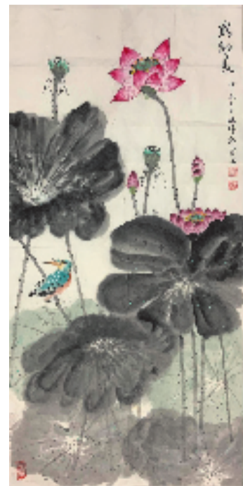
赵政伟 家乡美 68x136cm 国画