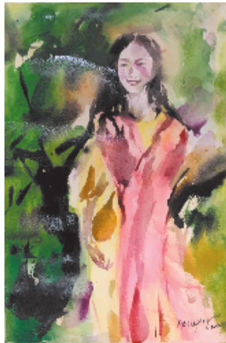
谢苏萍 夏 38x56cm 水彩