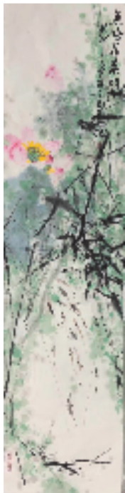
林东裕 鱼戏荷叶间 168x34cm 国画