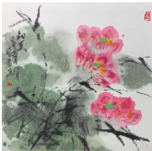
童暗香 和美 50x50cm 国画