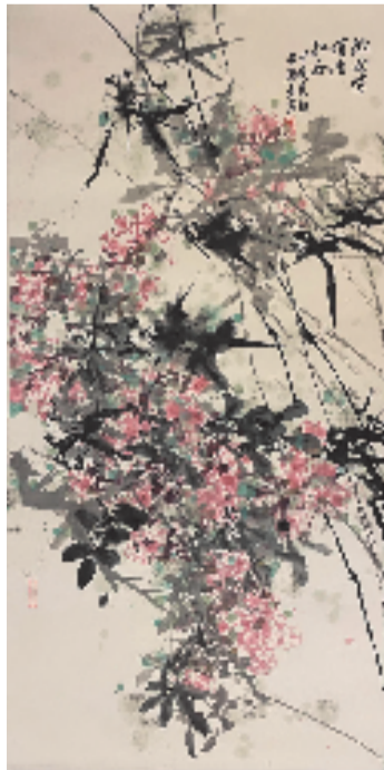
钱亚男 微雨悄悄催红妆 68x136cm 国画