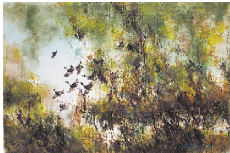
柴侠英 春归 78x56cm 水彩