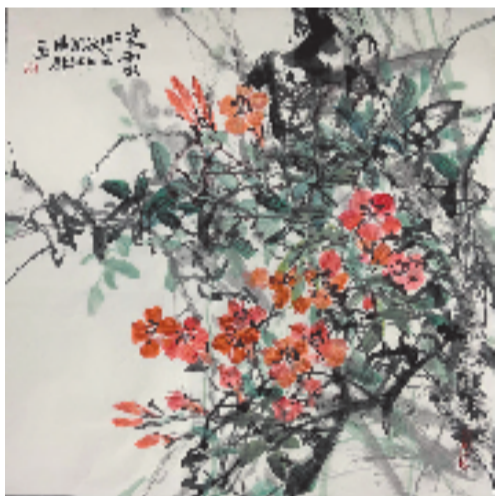
汤群 凌云 68x68cm 国画