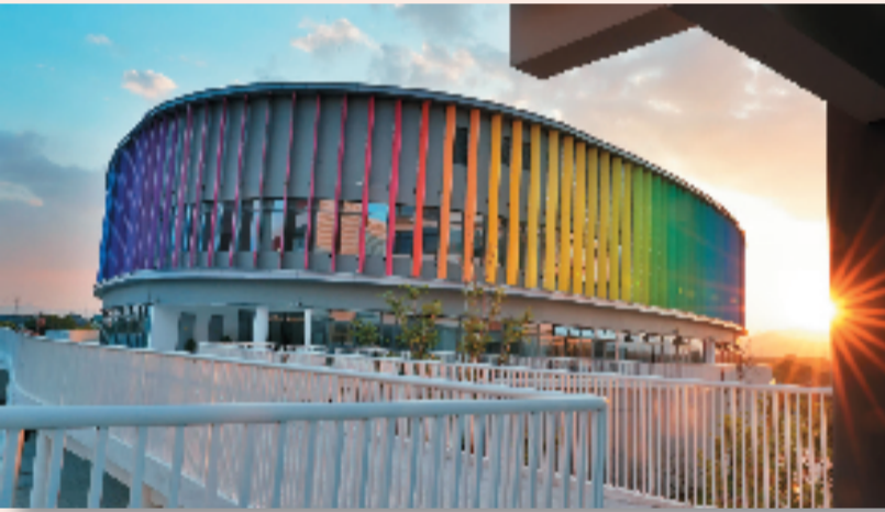
衢高新校园艺术楼

就像林语堂先生说的，“我要一间自己的书房，可以安心工作”。这里可以展现他们的魅力，这里是艺术家的精神乌托邦。衢高人坚定地认为，教师是学校最宝贵的美育资源，教师的素养决定了学校美育的质量。所以我们这15年，也在坚持开展教师美育素养提升行动。我们相信，美的老师，成就美的教育；美的教育，成就美的学生。