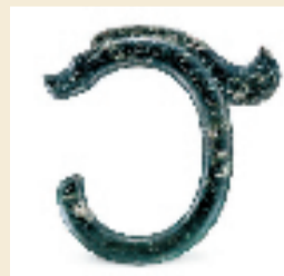
新石器时代晚期 红山文化玉龙