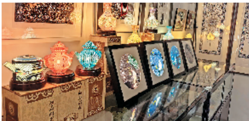
国家级非遗项目硖石灯彩作品展示