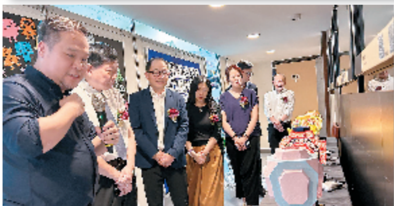
嘉宾们观赏国家级非遗项目仙居无骨花灯