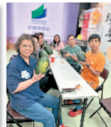
非遗工作坊平湖西瓜灯技艺体验制作

澳门,中西文化交汇的桥梁,拥有独特的历史背景和多元的历史文化积淀。浙江省,东南沿海的重要省份,同样拥有深厚的文化底蕴和多样的非物质文化遗产。本次交流展不仅展示了浙江地区优秀的非物质文化遗产项目,更是促进浙澳两地文化交流与合作的重要桥梁。