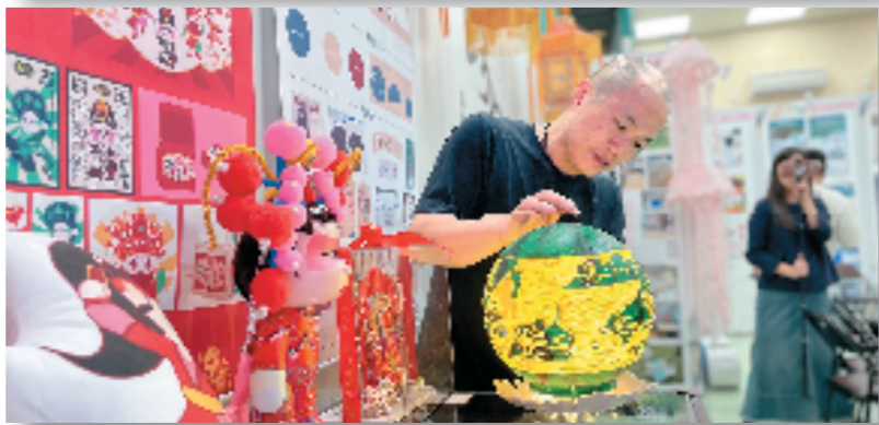
浙江省级非遗项目平湖西瓜灯