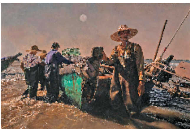
王峥(宁波) 落霞晚帆 180×120cm 油画