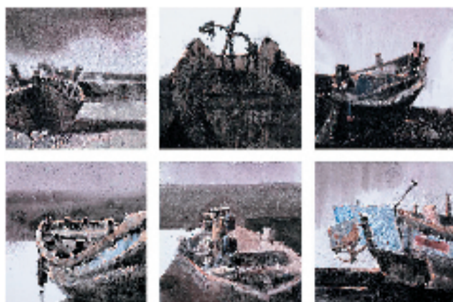
叶德意(温州) 憩 40×40cm 水彩画