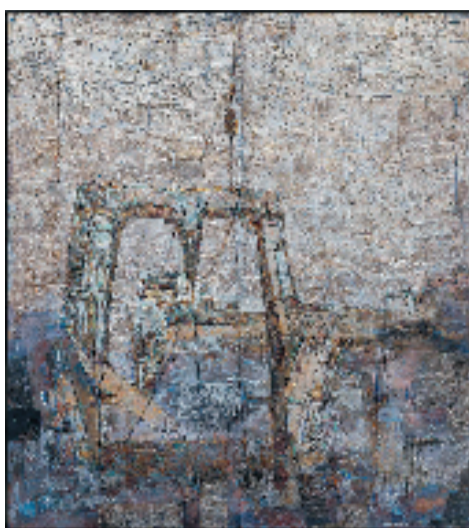
胡草丽(宁波) 潮起东海 200×180cm 综合材料