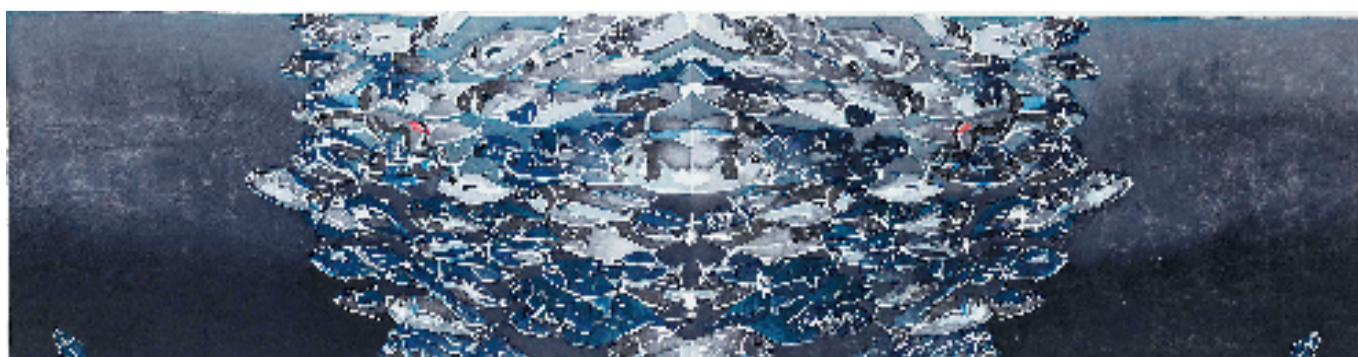
叶琛(杭州) 深海之眸 38×150cm 水印木刻