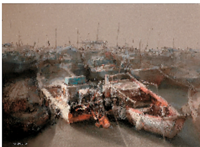
沈建江(嘉兴) 海边的船 135×100cm 色粉画