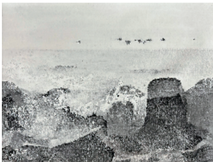
卢文静(台州) 瀚海潮生 60×90cm 水印版画