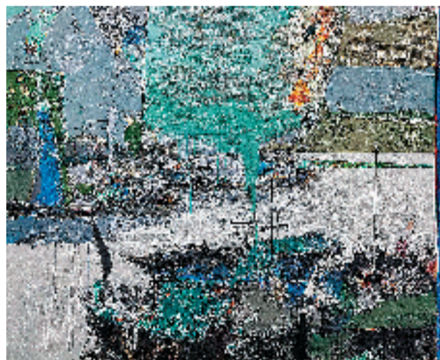
姚艾雨(湖州) 乘风破浪三 100×120cm 油画