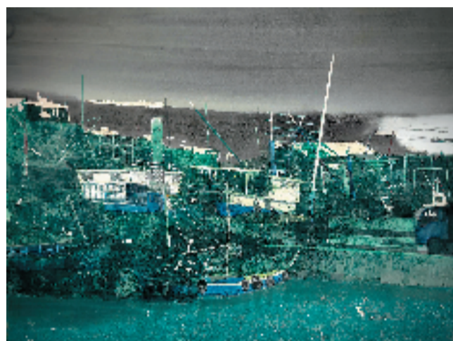
冯一豪(衢州) 海韵船歌 112×150cm 水彩