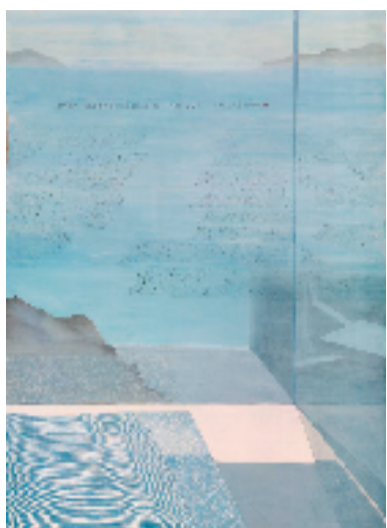
郭姗姗(舟山) 东极岛的午后 187×137cm 中国画

在当下新时代文艺实践中,“海洋”主题创作以大海为依归,与时代同行,与人民同心,溯源承流,必定有助于推动富有浙江海洋大省代表性的美术精品不断涌现。