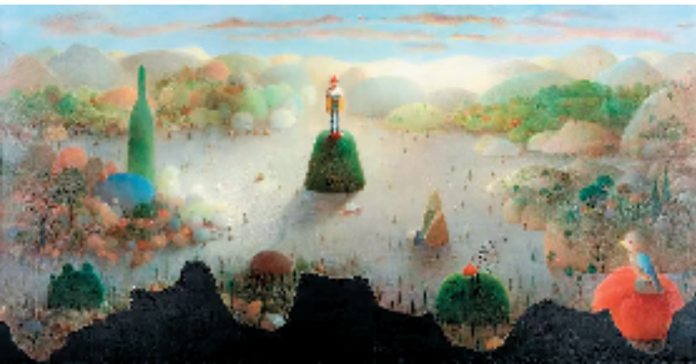
2011年成交价:690万元 中国嘉德 陈可 草垛上的小丑 180x350cm 油画

此外,王兴伟、仇晓飞、毛焰,尽管他们在本季秋拍中上拍作品数量不多,但在中国嘉德均有超过1000万甚至2000万元的高单价作品诞生。