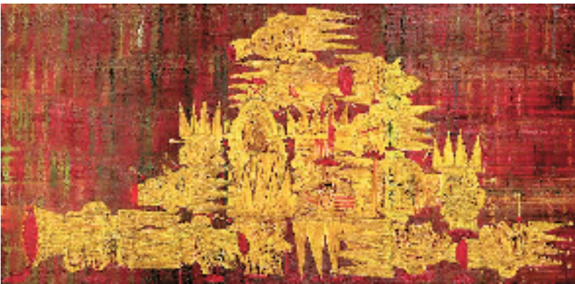
575万元 中国嘉德 欧阳春 国王山之一(三联作) 190x130cmx3 布面油画 2006 成交价: